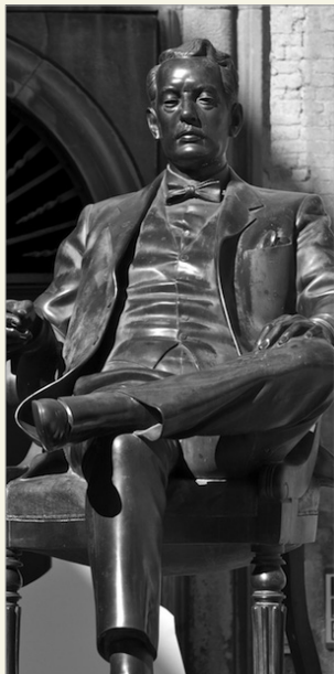
Monumento a Giacomo Puccini de Vito Tongiani (1994), plaza Cittadella, Lucca.